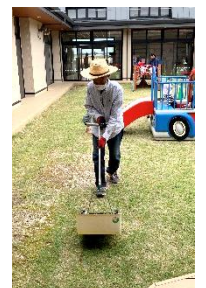
25日(木)中庭の芝刈りの様子