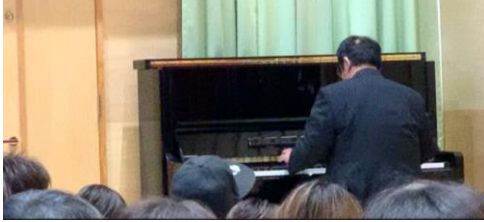
← Forever Love とラ・カンパネラを披露し ていただきました。YOSHIKI に見えました。