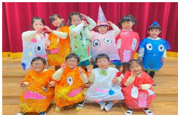
ばけばけばけばけ ばけたくん チーム