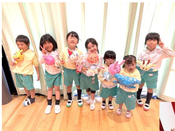
おおかみと7匹の動物たち チーム