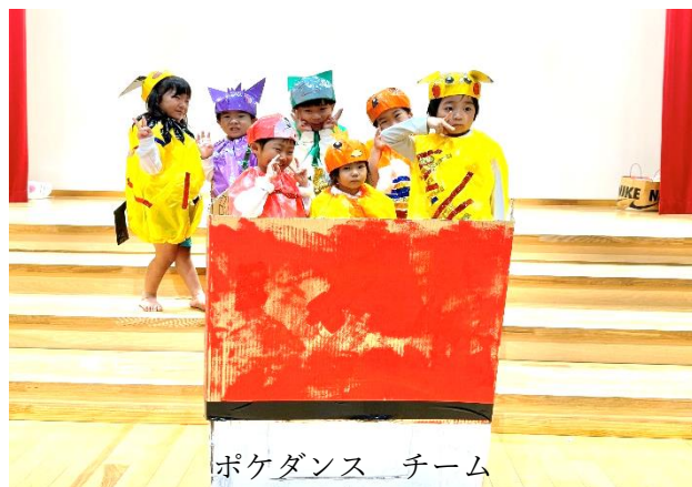
ポケダンス チーム