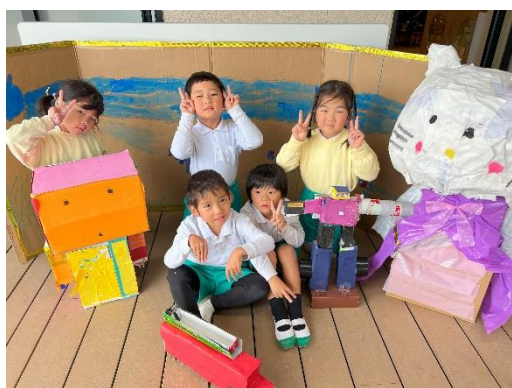
ぼくたち、わたしたちの好きなもの チーム