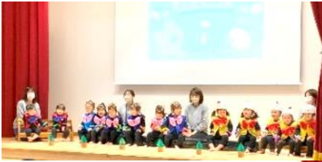
← ↓ 博愛っ子みらいモンスターたちも 愛情いっぱい育てられ、 いつのまにか頼もしくなりました！