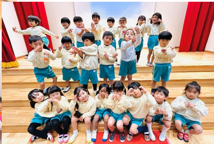
HAKUAI Collection 2024 チーム