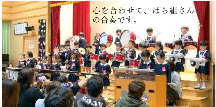
心を合わせて、ばら組さん の合奏です。