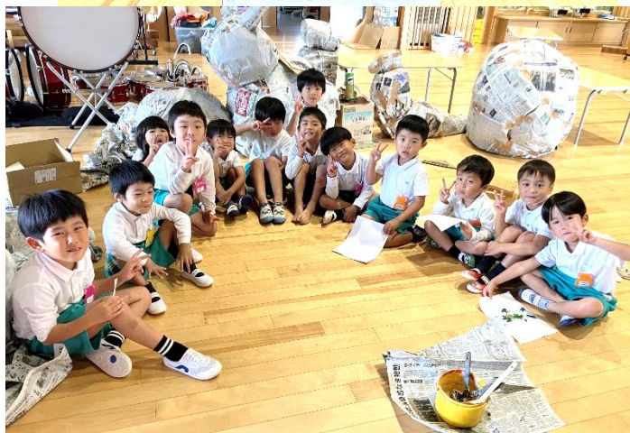
ポケモンのまち チーム