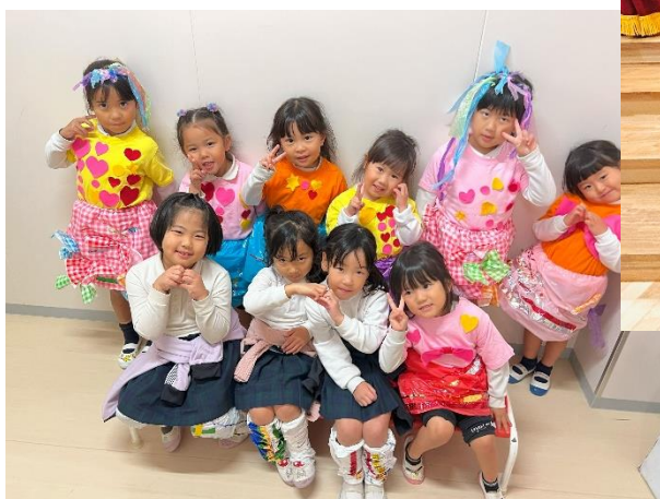
しなこワールド チーム