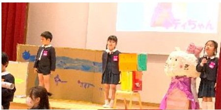
以上見たち 79 名合同でのグループ発表 です。